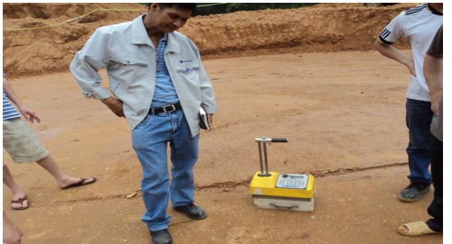
THÍ NGHIỆM ĐỘ CHẬT VÀ ĐỘ ẨM BẰNG MÁY ĐO PHÓNG XẠ TẠI DỰ ÁN ĐƯỜNG CAO TỐC NỘI BÀI - LÀO CAI GÓI THẦU A5