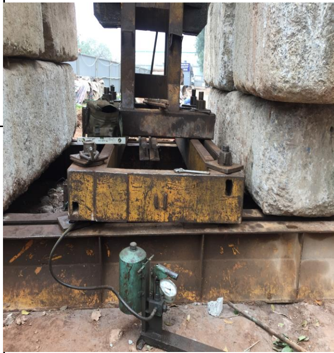
THÍ NGHIỆM SỨC CHỊU TẢI CỦA CỌC BẰNG PP NÉN TĨNH TẠI CẦU VƯỢT AN DƯƠNG