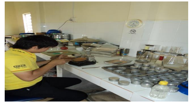
THÍ NGHIỆM GIỚI HẠN CHẢY TẠI DỰ ÁN ĐƯỜNG CAO TỐC NỘI BÀI - LÀO CAI GÓI THẦU A5