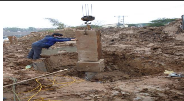
THÍ NGHIỆM PDA TẠI DỰ ÁN PHÁT TRIỂN CÔNG VIÊN YÊN SỞ