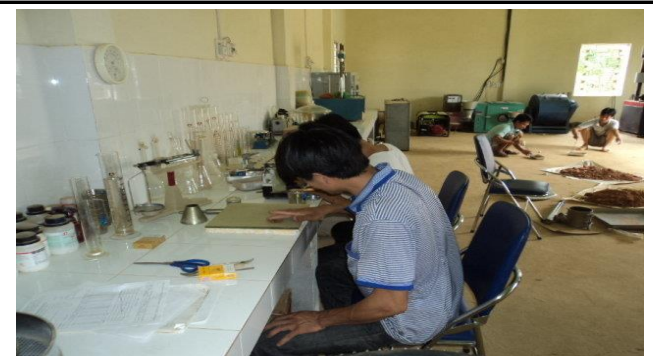
THÍ NGHIỆM GIỚI HẠN DỄ TẠI DỰ ÁN ĐƯỜNG CAO TỐC NỘI BÀI - LÀO CAI GÓI THẦU A5