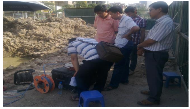
KIỂM TRA CHẤT LƯỢNG CỌC KHOAN NHỒI BẰNG PHƯƠNG PHÁP SIÊU ÂM TẠI DỰ ÁN CẦU VƯỢT NGUYỄN CHÍ THANH