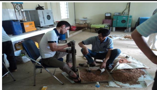
THÍ NGHIỆM ĐÀM CHẬT TRONG PHÒNG THÍ NGHIỆM TẠI DỰ ÁN ĐƯỜNG CAO TỐC NỘI BÀI - LÀO CAI GÓI THẦU A5