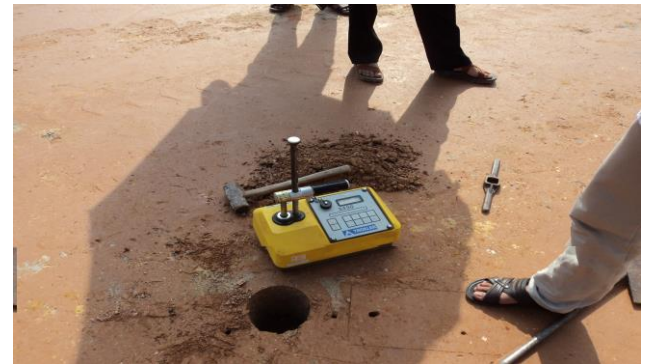
THÍ NGHIỆM ĐỘ CHẶT VÀ ĐỘ ẨM BẰNG MÁY ĐO PHÓNG XẠ TẠI DỰ ÁN ĐƯỜNG CAO TỐC NỘI BÀI - LÀO CAI GÓI THẦU A5