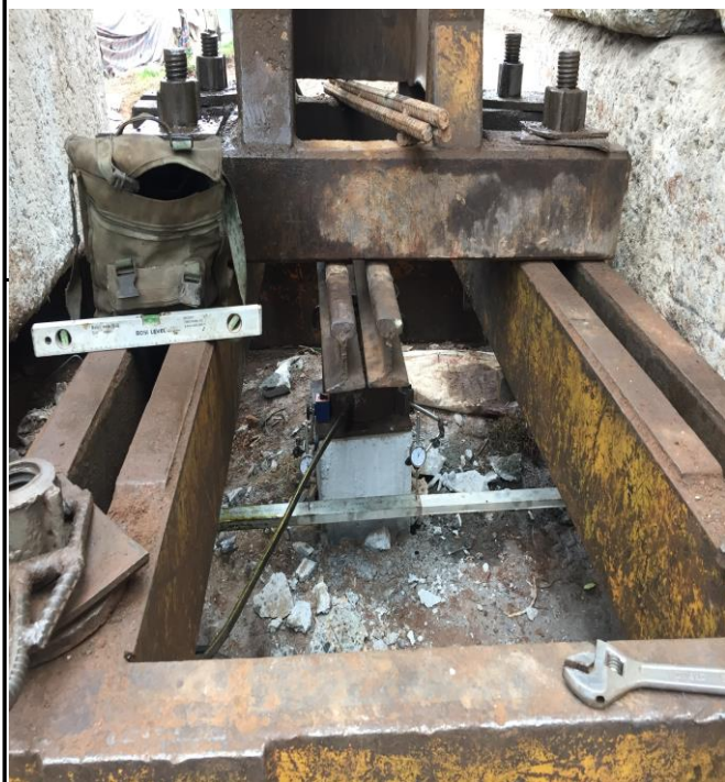
THÍ NGHIỆM SỨC CHỊU TẢI CỦA CỌC BẰNG PP NÉN TĨNH TẠI CẦU VƯỢT AN DƯƠNG

Tel: (024) 37868862 - Fax: (024) 37868862 - Email: newind209@gmail.com