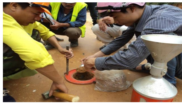
THÍ NGHIỆM ĐỘ CHẬT HIỆN TRƯỜNG TẠI DỰ ÁN ĐƯỜNG CAO TỐC NỘI BÀI - LÀO CAI GÓI THẦU A5