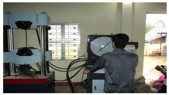
THÍ NGHIỆM KÉO THÉP TẠI DỰ ÁN ĐƯỜNG CAO TỐC NỘI BÀI - LÀO CAI GÓI THẦU A5