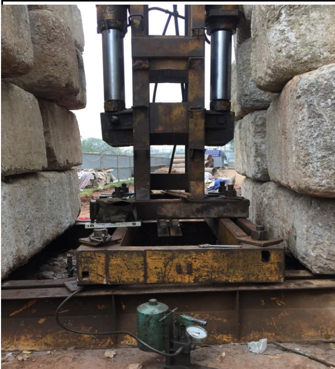
THÍ NGHIỆM SỨC CHỊU TẢI CỦA CỌC BẰNG PP NÉN TĨNH TẠI CẦU VƯỢT AN DƯƠNG