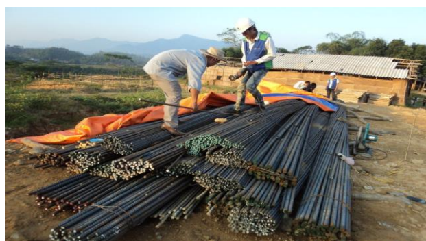
LẤY MẪU THÍ NGHIỆM THÉP TẠI DỰ ÁN ĐƯỜNG CAO TỐC NỘI BÀI - LÀO CAI GÓI THẦU A5