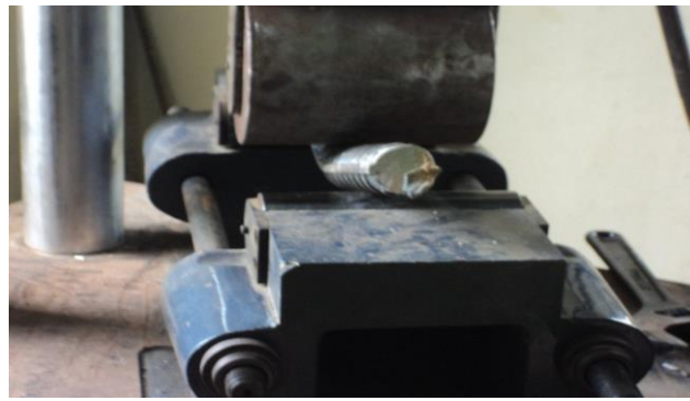
THÍ NGHIỆM UỐN THÉP TẠI DỰ ÁN ĐƯỜNG CAO TỐC NỘI BÀI - LÀO CAI GÓI THẦU A5

Tel: (024) 37868862 - Fax: (024) 37868862 - Email: newind209@gmail.com